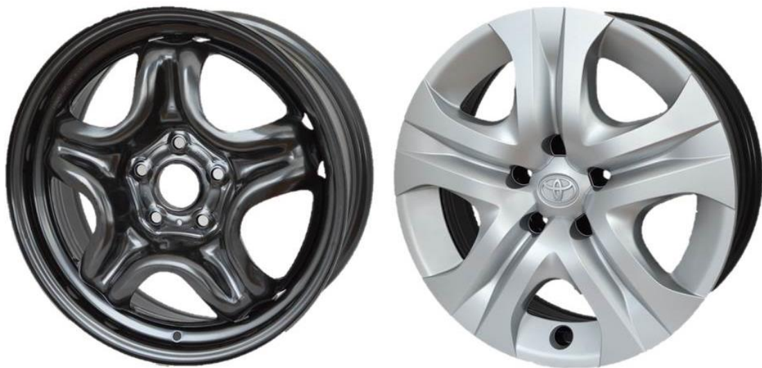
写真：（左から）ホイールキャップ非装着時、ホイールキャップ装着時