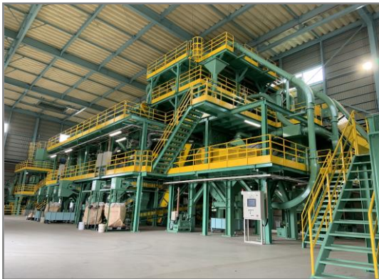
ダスト破碎選別設備